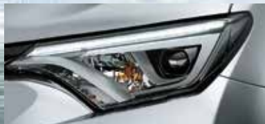
Faros delanteros Bi-LED con nivelación automática en altura y sensor crepuscular.