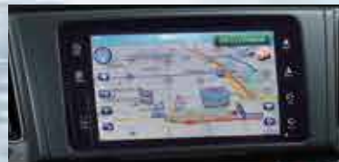
Audio con pantalla táctil de 7" con navegador satelital (GPS), CD, MP3, Bluetooth®, entradas auxiliares y USB.