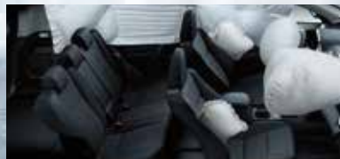
7 airbags: de rodilla para conductor, frontales y laterales para conductor y acompañante y de cortina para conductor, acompañante y pasajeros.